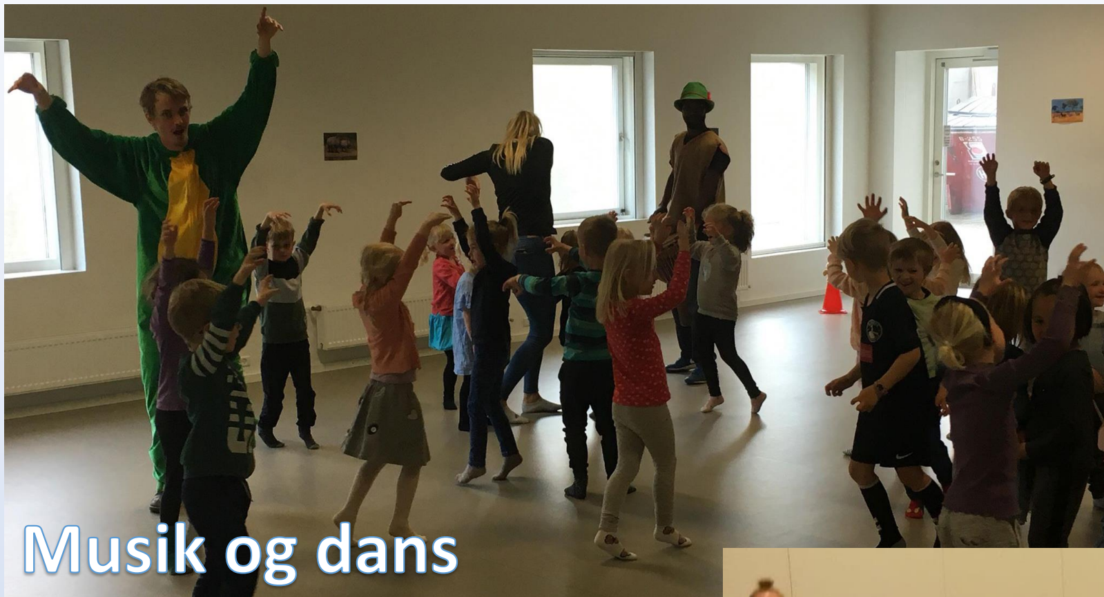
Musik og dans