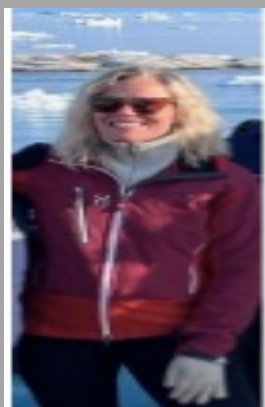
Af pædagogisk assistent studerende

Uddannelsen er rigtig god til de medarbejdere, der ønsker at stå stærkere i anvendelsespædagogik, er ønsket derimod en større forståelse for teorien bag pædagogikken, er det pædagoguddannelsen, der egner sig bedst.